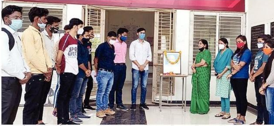
स्वदेश संवाददाता, भोपाल

श्यामा प्रसाद मुखर्जी के जीवन से छात्रों को यह प्रेरणा लेनी चाहिए कि निरंतर कार्य करना और एक उद्देश्य