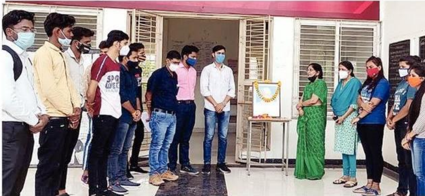
स्वदेश संवाददाता, भोपाल

श्यामा प्रसाद मुखर्जी के जीवन से छात्रों को यह प्रेरणा लेनी चाहिए कि निरंतर कार्य करना और एक उद्देश्य