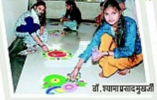
डॉ. श्यामा प्रसाद मुखर्जी