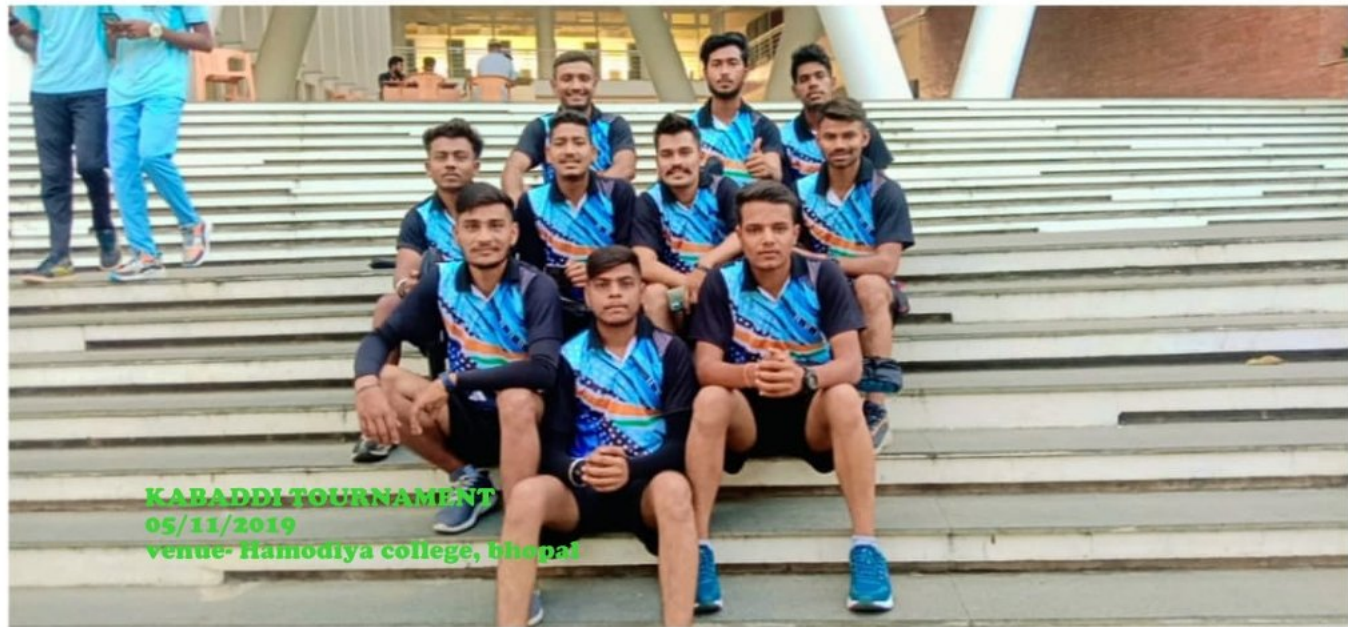
KABADDI TOURNAMENT 05/11/2019 venue- Hamodiya college, bhopal